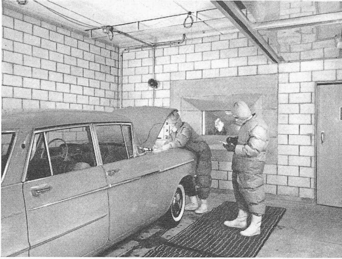
Bild 2. Grosse Kältekammer für Kaltstart- und Betriebsversuche an Motorfahrzeugen bei Temperaturen bis -50^{\circ}\text{C}