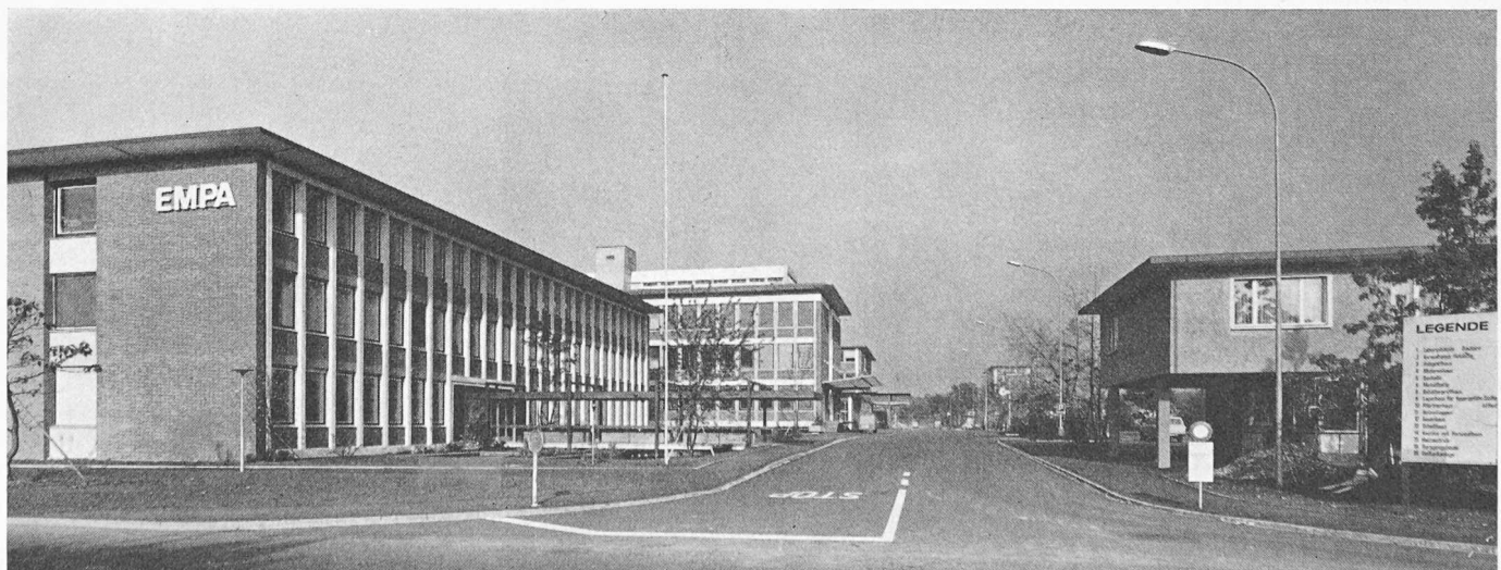
Bild 1. Eingang zu den EMPA-Neubauten an der Ueberlandstrasse in Dübendorf ZH

Dieses Vorhaben gab Anlass zu heftigen Auseinandersetzungen. Aeusserlich drehten sie sich um die Wahl des Standortes und um Einzelheiten in der Aufgliederung. Im Grunde genommen war es aber bei der Hochschulbehörde wie bei der Leitung der Anstalt das Unbehagen, ETH und EMPA räumlich voneinander trennen zu müssen, was ein tatkräftiges Handeln verunmöglichte. Es bedurfte des völligen Wechsels der beteiligten Personen und einer Zeit, die andern Auffassungen eher gewogen war, um zur Lösung zu kommen. Sie brachte der EMPA eine grosszügige, einheitliche und funktionstüchtige Anlage, zugleich aber auch die entschlossene Verlegung aus dem Hochschulviertel in Zürich nach dem Vorort Dübendorf. Für den späteren Ausbau bestehen Reserven an freiem Gelände, das auch andern Annexanstalten der ETH noch Raum lässt.