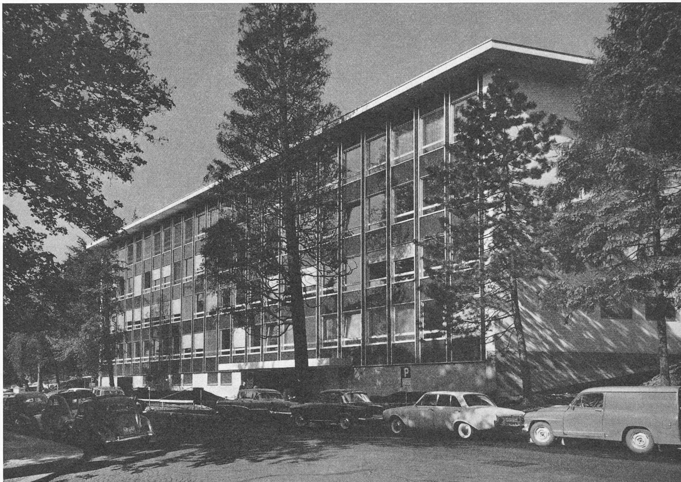
Der Neubau für das Schulamt der Stadt Zürich, vom Parkring aus gesehen

Das Amtshaus Parkring ist das erste öffentliche Gebäude der Stadt Zürich, das von einem Generalunternehmer (unter Beizug einer Architektenfirma) gebaut worden ist. Seine Erstellung und der Mietgebrauch durch die Stadt haben im Gemeinderat zu einer lebhaften und langen Diskussion über das Pro und Contra dieser Angelegenheit geführt. Tatsache ist aber, dass die Stadtverwaltung von Zürich durch die Zusammenarbeit mit der Firma Karl Steiner eines ihrer drückendsten Raumprobleme lösen konnte zu Bedingungen, die nicht als ungünstig zu bezeichnen sind. Immerhin handelt es sich beim Amtshaus Parkring um besondere Umstände, die nicht ohne weiteres als schlüssiger Präzedenzfall für die Errichtung weiterer öffentlicher Bauten im Generalunternehmer-Verhältnis gelten können. Mit den nachstehenden Ausführungen zur Baugeschichte des neuen Amtshauses am Parkring möchten wir namentlich den Architekten eine kurze Orientierung zu einer Frage bieten, die diesen Berufsstand nicht weniger — vielleicht aber unmittelbarer — beschäftigten muss, als es beim Zürcher Gemeinderat der Fall war.