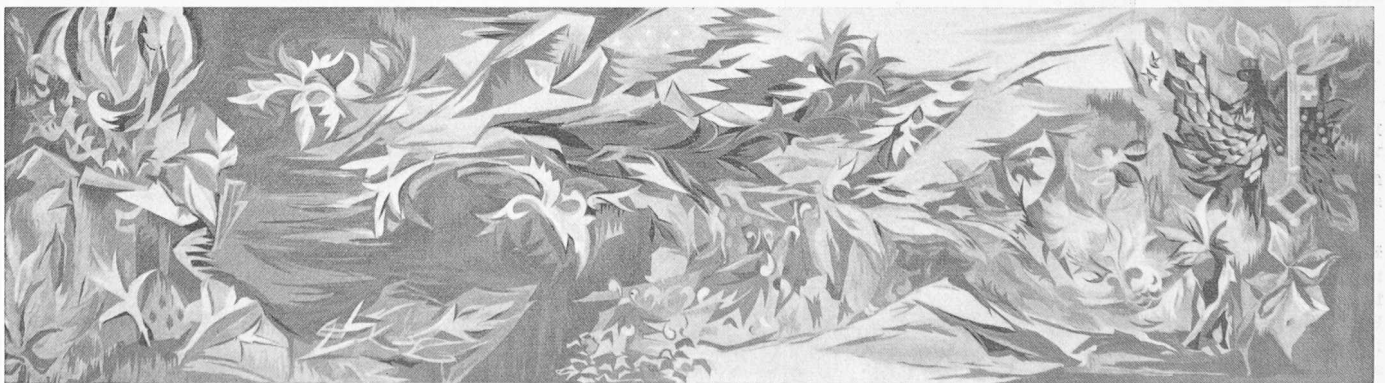
Entwurf von Rose-Marie Eggmann , Genf, für einen Wandteppich im Genfer Grossrats-Saal. In der Bildecke rechts oben die Embleme des Genfer Wappens. Leider lässt die Schwarz/weiss-Wiedergabe die farblichen Qualitäten des Entwurfes nicht erkennen.

Présentée sur place la maquette s'est révélée tout à fait appropriée à la décoration projetée. Ce projet est bien conçu pour une réalisation en tapisserie.