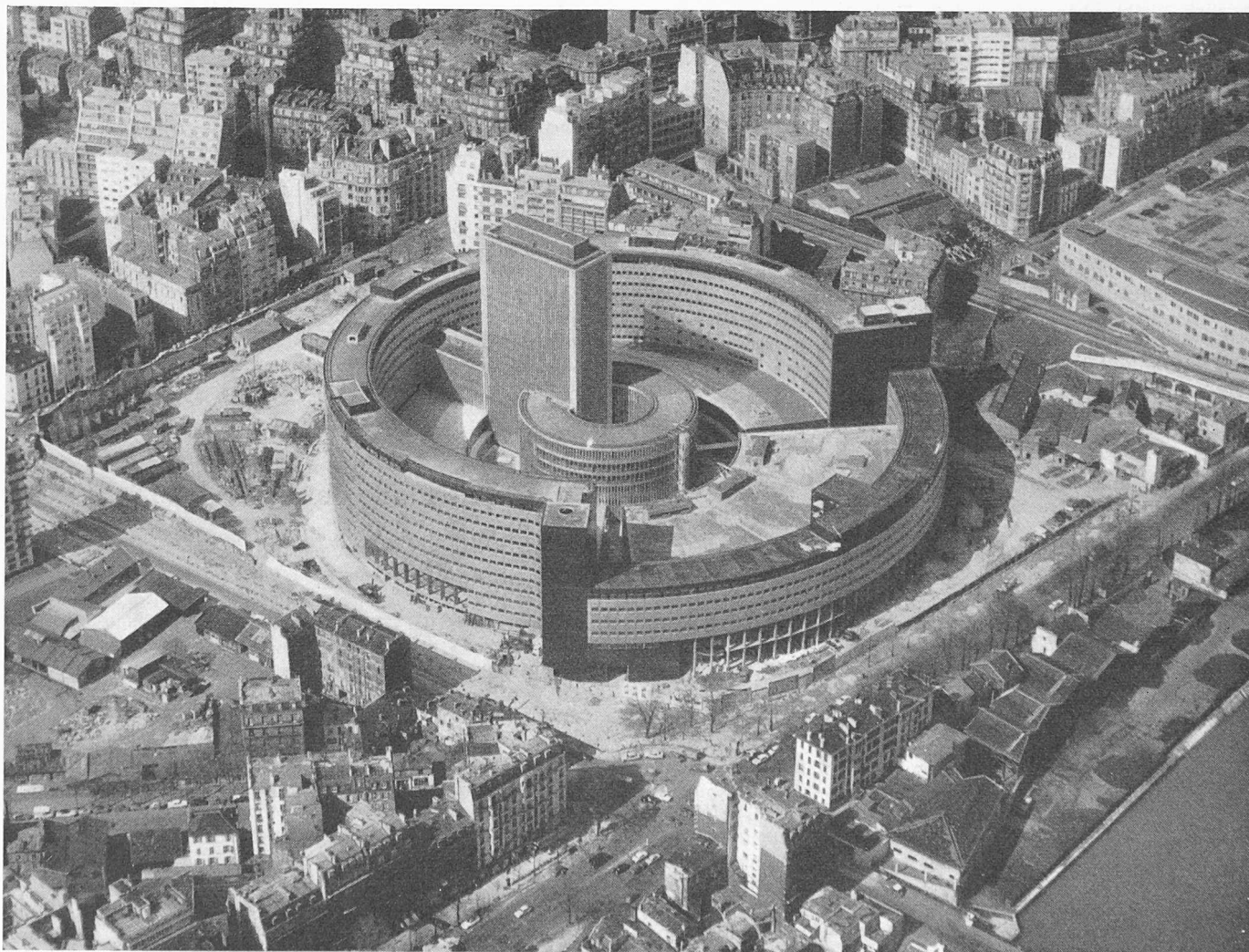
Das Radiogebäude in Paris, Quai de Passy (rechts unten die Seine), aus Süden

Besondere Sorgfalt wurde auf die Schallsolation der Vortragsäle und Studios untereinander und nach aussen verwendet. Man benutzte ganz konsequent die Methode der unabhängigen Kästen, die vollständig auf elastischem Material ruhen. So besteht zum Beispiel jeder der drei grossen öffentlichen Säle aus zwei ineinander gestellten, auf keinerlei Weise verbundenen Hüllen. Die innere Hülle umfasst die Saaldecke, die armierten, ausgefachten Wände und den Boden mit Ballastschicht gegen Auftrieb bei Seine-Hochwasser. Zur äusseren Hülle gehören das als Terrasse ausgebildete Dach und die selbsttragenden Aussenmauern, die auf den Pfehlen ruhen. Zwischen den Fundationen beider Hüllen verläuft eine gedichtete Fuge. Die genannten Aussenmauern tragen frei über 33 m Spannweite, sie enthalten einen Eisenbetonbogen mit vorgespanntem Zugband. Besonders bemerkenswert ist die Tragkonstruktion des Daches. Die 10 cm starke Ortbetonplatte wird über vorfabrizierte Querträger von den vier vorgespannten Hauptträgern getragen, die 2,50 m hoch sind und 41,26 m überspannen. Die Decke der inneren Hülle folgt dieser Untersicht angenähert, indem sie