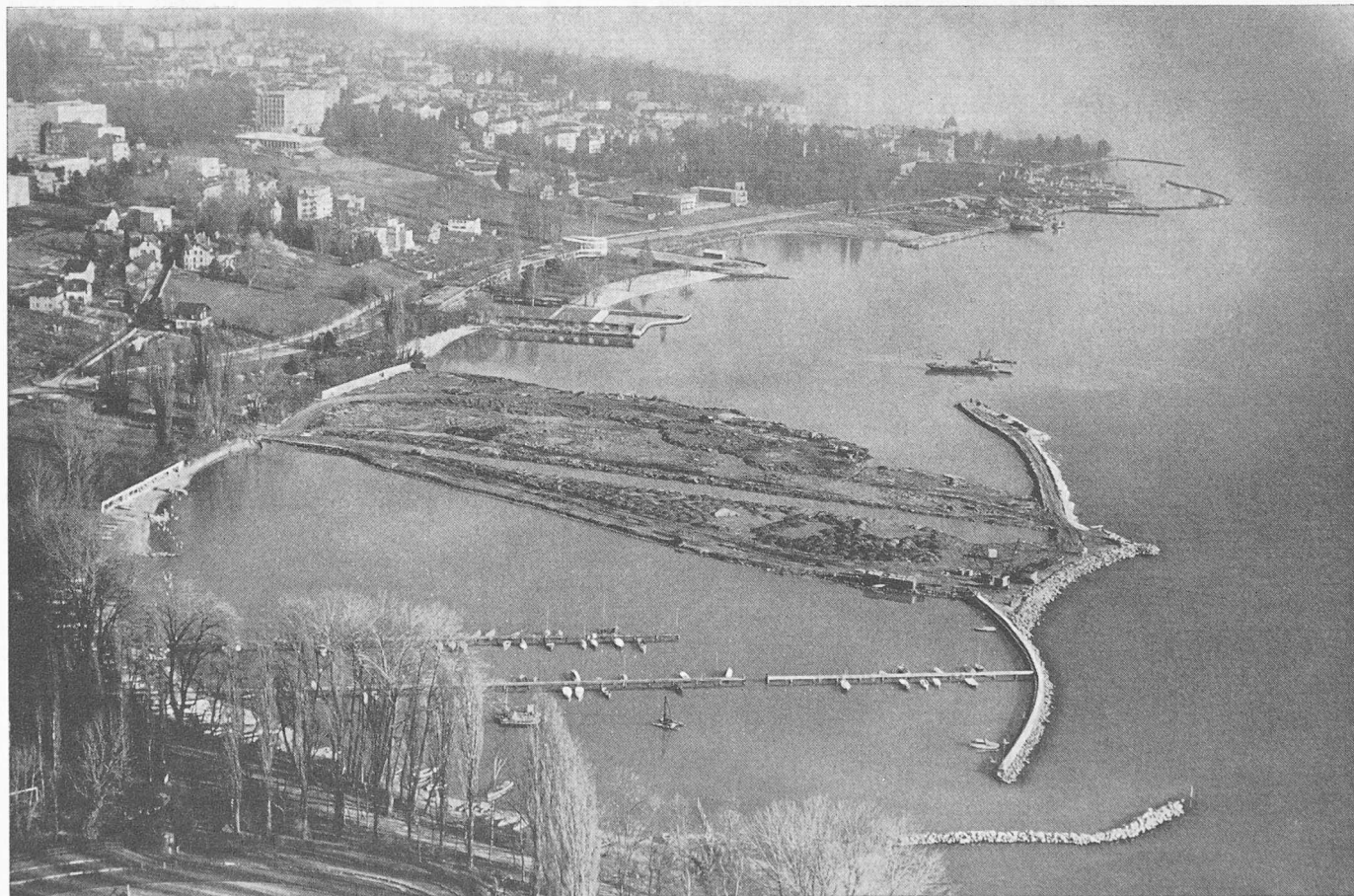
Bild 2. Stand der Arbeiten am 1. Februar 1960, aus Westen. Im Vordergrund der alte Hafen von Vidy, dahinter die Auffüllung, geschützt durch die neue Mole und den neu geschütteten Strand. Der in der Auffüllung offen gelassene Graben ist bestimmt für einen Entlastungskanal für Gewitterregen

Die Arbeiten wurden im März 1959 vergeben und unmittelbar darauf in Angriff genommen; die Schüttungen begannen am 13. Juni 1959. Am 28. Februar 1961 bewilligte