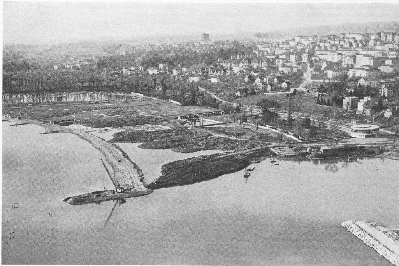
Bild 3. Stand der Arbeiten am 27. Februar 1961, aus Osten. Hinten der alte Hafen von Vidy, vom linken Bildrand aus die Dammschüttung mit den Spornen, auf welche sich der künstliche Strand stützen wird. Links unten spiegeln sich im See die Profile für die Abstekung. In Bildmitte die Aufschüttung vor dem Strandbad Bellerive, dessen Hauptgebäude am rechten Bildrand sichtbar ist.

Im ganzen wird durch die Aufschüttung eine Fläche von 250 000 m 2 gewonnen. Die gesamte neue Uferlänge be-