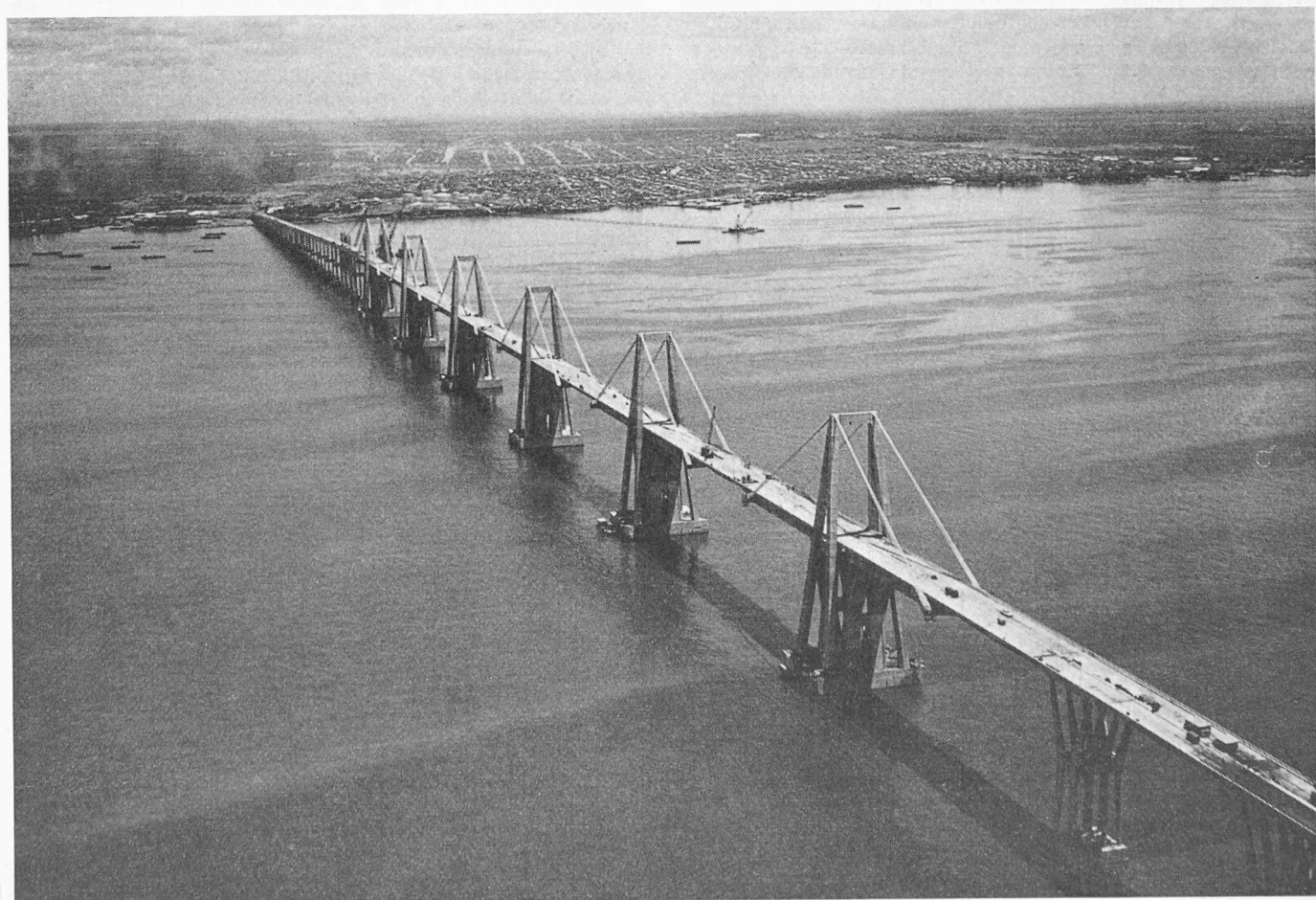
Bild 2. Brücke über den Maracaibosee, Flugaufnahme des fertigen Bauwerks. Im Vordergrund die fünf Mittelöffnungen von je 235 m, im Hintergrund die Stadt Maracaibo (etwa 500 000 Einwohner)

Für weitere Einzelheiten sei verwiesen auf unsere Quelle: «Revista de obras publicas», Madrid, Nummer 2963, März 1962. Erwin Schmitter