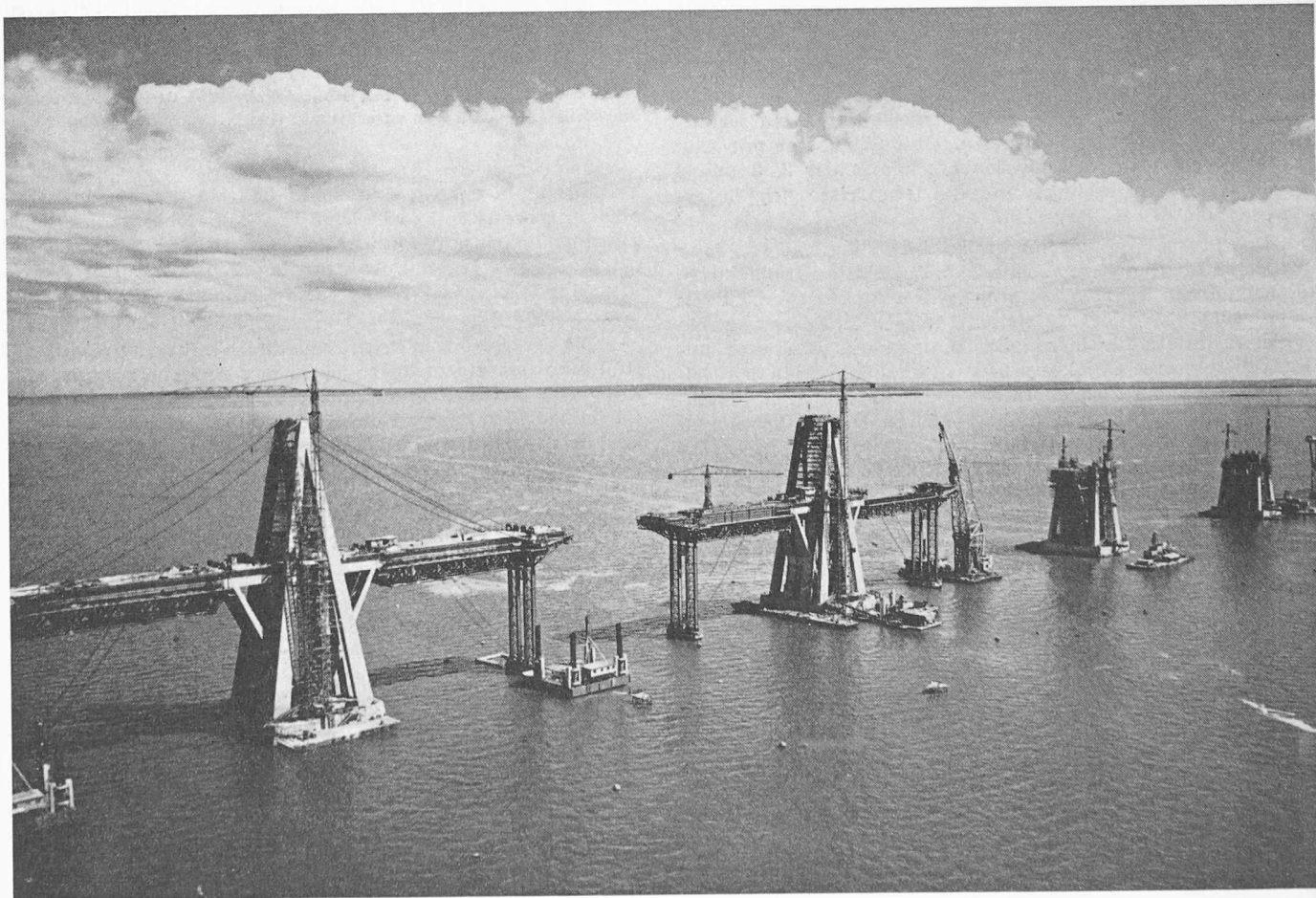
Bild 1. Brücke über den Maracaibo-See, Bauzustände von je 235 m. Die beidseits der Stützenkonstruktion auskragenden Auslegerbalken wurden auf provisorisch abgestützten Schalungsträgern betoniert, da sie erst durch das Spannen der Hängekabel ihre Tragfunktion erhielten

tierten Buch, das auch im Druck sehr ansprechend wirkt, sollen zum Schluss einen Ueberblick über die Grösse und die Verschiedenartigkeit der Bauaufgaben geben: mittl. Fehler an der Zentralbasis von 8,8 km Länge \pm 31 mm; totaler Materialverbrauch 270 000 m 3 Beton und 24 000 t Armierungs- und Spannstahl; totale Pfahlänge 70 000 lfm; durchschnittliche Anzahl Arbeitskräfte auf der Baustelle 2630 Mann; Gesamtkosten rund 400 Mio SFr. entsprechend 2500 SFr./m 2 Brückenoberfläche.