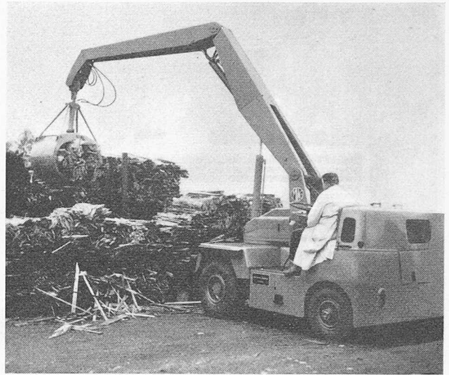
Mobilkran MSK 4 HG mit Spezial-Holzgreifer, Tragkraft 4 t. Für höhere Leistungsanforderungen steht der Mobilkran MSK 6 mit Holzgreiferausrüstung zur Verfügung. Diese Krane sind auch mit Normal-Kranhaken, mit Magnetausrüstung und mit Saugbevorrichtung erhältlich.

Bei den gegenwärtigen Verhältnissen auf dem Arbeitsmarkt stellen wir einen ausgeprägten Mangel an einhei-