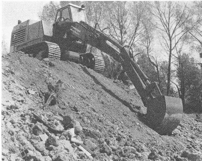
Hydrobagger Poclair TC 45 auf Raupen, vollkommen hydraulisch gesteuert, kann um 360° drehen. Tieflöffel 0,85 m breit, 0,3 m 3 Inhalt.

Der Wille der Unternehmerschaft, die gestellten Bauaufgaben möglichst wirtschaftlich auszuführen, der Wunsch der Bauherrschaften nach immer kürzeren Fertigstellungsfristen und vor allem der sich in den letzten Jahren immer schärfer abzeichnende Arbeitermangel waren die grossen Förderer dieser Entwicklung. Eine Rückläufigkeit ist undenkbar. Im Gegenteil. Es ist unschwer einzusehen, dass die letzten Möglichkeiten einer Mechanisierung noch lange