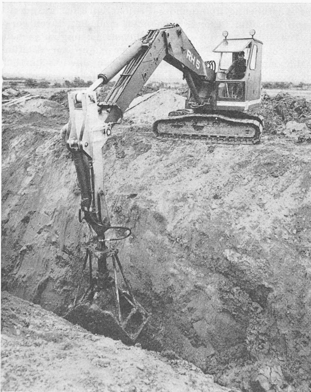
O+K-Universal-Raupen-Hydraulikbagger Typ RH5 mit Tief-löffelausrüstung. Fahrtrieb, Drehbewegung und Arbeitsbewegung erfolgen hydraulisch durch Oelmotoren, welche durch selbstregelnde Pumpen gespeist werden. Der Bagger passt seine Arbeitsgeschwindigkeit automatisch dem Arbeitswiderstand an, d. h. er arbeitet so schnell wie möglich und ist so stark wie nötig.

Die Bauaufsicht gliedert sich in eine technische und eine kaufmännische Abteilung. Durch die Mechanisierung sind der Bauaufsicht weit grössere Aufgaben erwachsen. Die Maschine hat wohl die Zahl der manuellen Arbeitskräfte stark vermindert; aber die technische Arbeit des Ingenieurs, Technikers, Bauführers ist durch die raschere Bauweise viel anspruchsvoller und umfangreicher geworden. Zu den technischen Problemen kommen wesentliche Organisationsfragen für den rationellen Einsatz der Maschinen. Grössere Baustellen brauchen eigene Maschinentechiker für die Betreuung des Parkes. Im kaufmännischen Sektor wird das Lohnwesen infolge verschiedener Sozialzuschläge und Steuerabrechnungen immer komplizierter. Der Einkauf von allen notwendigen Bestandteilen und Ersatzteilen und deren kalkulatorische