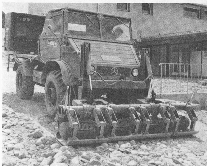
Brigel-Mehrplattenverdichter auf Unimog. Mit 4 Platten (Arbeitsbreite 2,40 m) kann er auf öffentlichen Strassen zirkulieren, kommt aber auch in schwierigem Gelände durch. Vibrationsplatten und Generator können in kurzer Zeit vom Unimog demontiert und jeder Teil für sich verwendet werden.

Kosteneinsparungen können auch erzielt werden, wenn ein zur Ausführung kommendes Projekt wirklich ausgereift ist, wenn Zeit und Personal vorhanden sind, um durch sorgfältige Detail-Studien die wirtschaftlichste Lösung zu suchen. Es kommen heute Projekte «Hals über Kopf» zur Ausführung, die ohne genügende Projekt-Studien unwirtschaftlich gebaut werden. So kommt es zum Beispiel heute vor, dass ein Bauelement stärker als nötig ausgeführt wird, dass eine Eisenarmierung schwerer als nötig angenommen wird, dass eine teurere Fundamentsart gewählt wird, nur weil keine