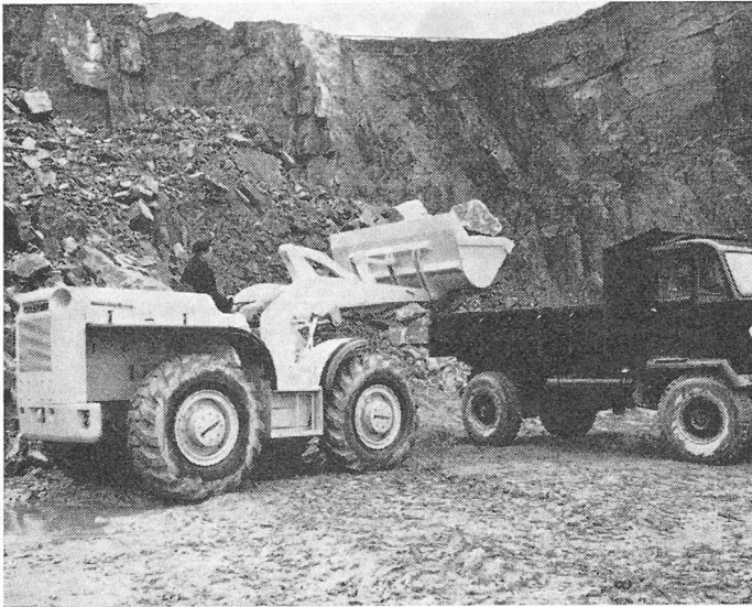
Chaseside-Lader SL. Drei Modelle mit Fassungsvermögen von 0,95 bis 1,85 m 3 und Motor von 96 bis 137 PS.