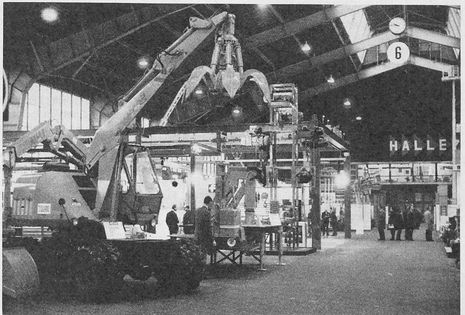
Blick in die Halle 6

Mit anderen Worten: Verzicht auf das hierzulande so beliebte Prinzip: «Jeder macht alles», das einen so unerhörten Verschleiss an Menschen, Geld und Energie bedeutet. Die hier liegenden Produktivitätsreserven übersteigen alles, was bisher innerbetrieblich