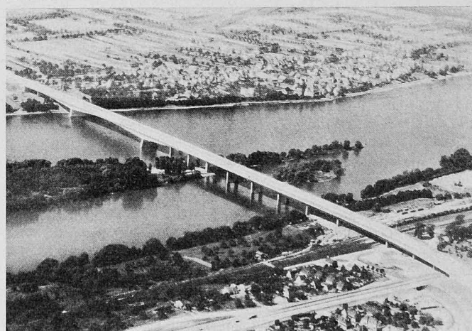
Bild 1. Rheinbrücke Bendorf im Zuge der Autobahn Montabaur-Trier mit 208 m Spannweite in der Mittelöffnung, die derzeit weitestgespannte Spannbetonbrücke im Freivorbau der Welt (während des Baues Hilfs-pylonen)