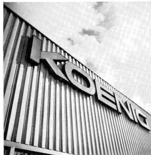
für Fassaden und Bedachungen