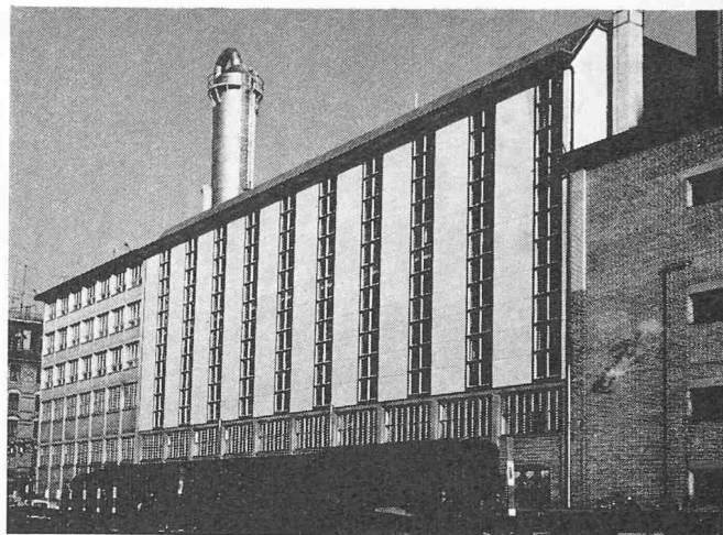
Bild 3. Ansicht von der Hardstrasse

Da die Wandelemente Polymur und Fenster in sehr grossen Teilstücken hergestellt wurden, konnte die Stahl-