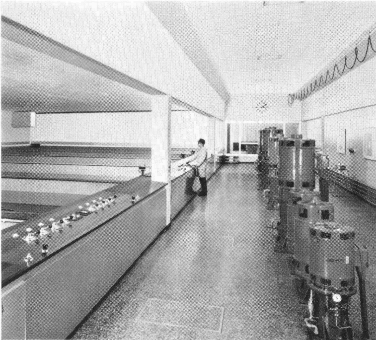
Schnellfilteranlage « Champ-Bougin » der Stadt Neuenburg für das Aufbereiten von Seewasser zu Trinkwasser. Leistung 1800 m 3 /h