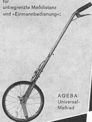
AGEBA Universal- Meßrad

für unbegrenzte Meßdistanz und «Einmannbedienung»: