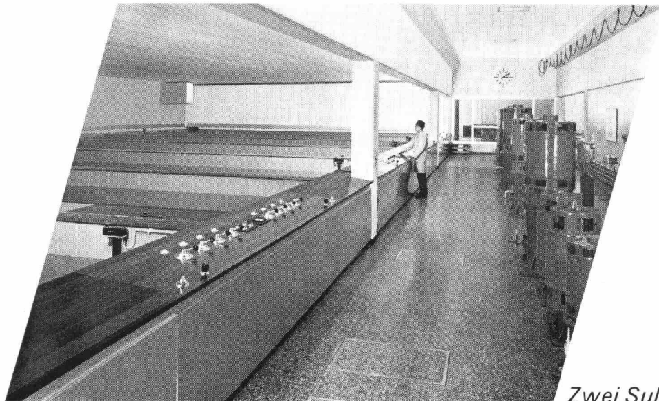
▲ Schnellfilteranlage «Champ-Bougin» der Stadt Neuenburg für das Aufbereiten von Seewasser zu Trinkwasser. Leistung 1800 m 3 /h

Unser vielseitiges Lieferprogramm und ein Stab erfahrener Ingenieure ermöglichen uns, auf dem Gebiet der Wasserversorgung und -aufbereitung optimale Lösungen anzubieten, welche Wirtschaftlichkeit und Betriebssicherheit gewährleisten.