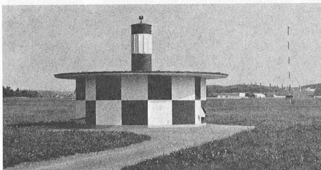
Bild 4. UKW-Drehfunkfeuer – VOR/DME Zürich-Kloten. Im Hintergrund die Antenne eines Mittelwellenfunkfeuers (nicht mehr in Betrieb)

Im Interesse der Sicherheit müssen zu jeder VOR-Station Kontrollgeräte aufgestellt werden. Diese bringen eine Warnvorrichtung zur Auslösung und schalten die Navi-