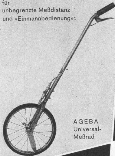
AGEBA Universal- Meßrad

für unbegrenzte Meßdistanz und «Einmannbedienung»: