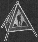
Gefahren-Faltsignale aus wetterbeständigem Plastic-Gewebe