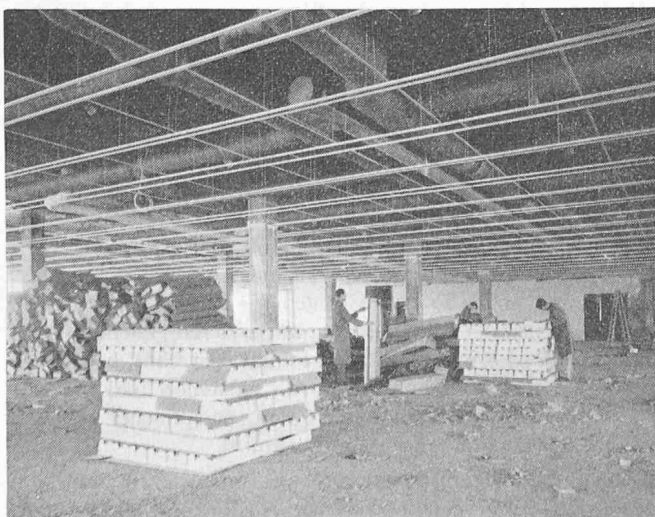
Bild 1. Unterkonstruktion der «Unipro»-Montagedecke, bestehend aus stranggepressten Aluminiumprofilen, die mit Gewindestangen an der Rohdecke aufgehängt werden