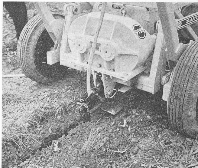
Bild 3. Mit dem Gerät Typ PT 90 erzeugter Bodenschlitz

Zum Einstossen von Telefon-, Strom- und anderen Leitungen in Kanäle hat die amerikanische Firma Champion in Hammond (Indiana) eine Spezialmaschine entwickelt, die in der Lage ist, Ruten von 300 bis 450 m Länge einzustossen, ohne dass Verwicklungen auftreten. Das System wird von einem 37-PS-Motor angetrieben, arbeitet vollhydraulisch und ist so einfach zu bedienen, dass sämtliche Vorgänge mit einer Hand gesteuert werden können. Beim Überschreiten der zulässigen Zug-, Druck- oder Drallkräfte unterbrechen Überdruckventile die Kraftzufuhr, so dass Überbeanspruchung der Rute und Beschädigungen der Kanäle oder Leitungen nahezu ausgeschlossen sind. Die Maschine kann als Anhänger oder für Lastwagenaufbau geliefert werden. Der Benzinmotor treibt zwei hydraulische Pumpen an, die bei 1700 U/min den erforderlichen Druck von 140 atü erzeugen. Zwei Hydromotoren, auf dem Antriebskopf montiert, setzen die Rutenantriebsrollen in Bewegung und gewährleisten in Verbindung mit einer geeigneten Haspelvorrichtung eine gleichmässige Längs- und Drehbewegung. Die Zug- und Stossgeschwindigkeit ohne Belastung bewegt sich im Langsamlauf zwischen 0 und 37 m/min mit entsprechend hoher Drehkraft und im Schnelllauf