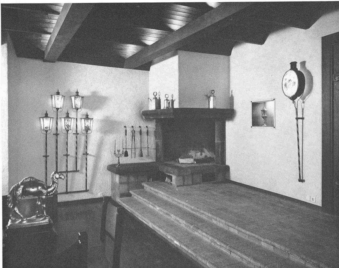
Cheminée an der Eingangsseite