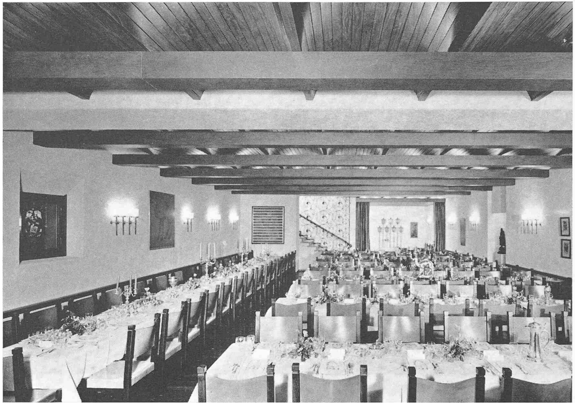
Die festlich gedeckten Tafeln im Zunftsaal