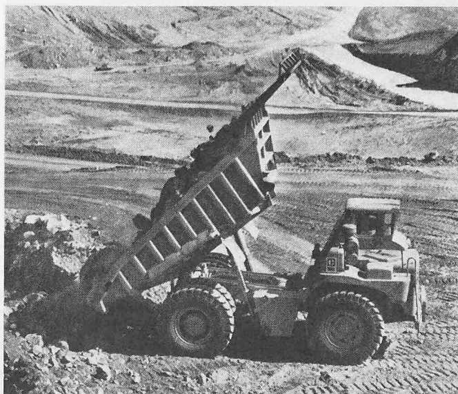
Bild 1. Muldenkipper Caterpillar 773. Die zwei dreistufigen Hydraulikstempel kippen den beladenen Aufbau in 12,7 s

Das Lastschaltgetriebe mit neun Vorwärts- und drei Rückwärtsgängen ist der Motorleistung angepasst. Ein verstärktes Verteilergetriebe, das direkt hinter dem Motor am Getriebe angebracht ist, überträgt je nach den einzelnen Gangstufen des Stufenbereiches die Kraft vom Wandler zum direkten Antrieb oder zum Schnellgang. Eine kurze Antriebswelle verbindet das Verteilergetriebe mit dem Gangbereichsgetriebe, das sich am Differentialgehäuse befindet.