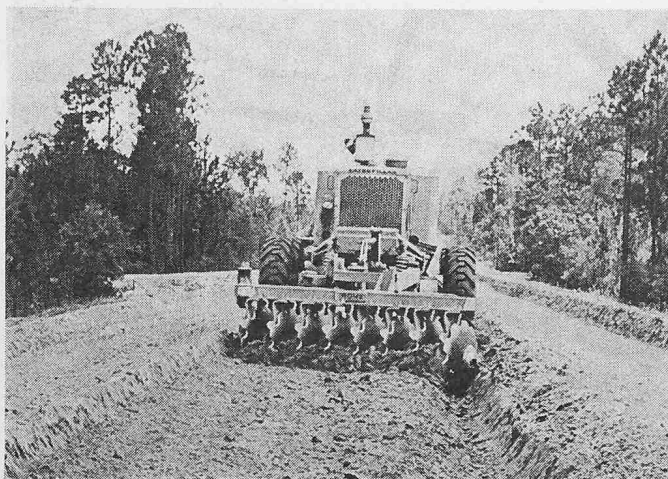
Bild 4. Die heckmontierte Scheibenegge lockert, zerkleinert und mischt das Material

sungsvermögen (gehäuft) ermöglicht dem Fahrer, Material ohne Schubtraktor zu laden, zu transportieren und abzukippen. Das Gerät kann vom Planierer aus gehoben, gesenkt, geneigt und nach beiden Seiten verschoben werden. Maschinen mit diesem Anbaugerät können V-förmige und breitsohlige Gräben schneiden, Terrassenäcker anlegen, Böschungen, Dämme und Deiche herstellen und instandhalten, Strassen neu bauen, Gräben und Entwässerungskanäle reinigen, Abhänge anlegen, sowie Schnee, Eis, Schotter und Streifhaufen räumen. Es kann von einem Mann in etwa 30 min an- oder abmontiert werden.