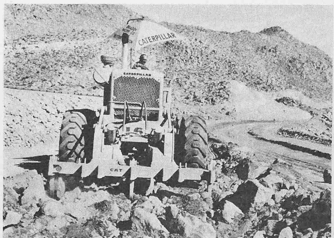
Bild 5. Der heckmontierte leichte Aufreisser wird zum Aufreissen von zähem Material eingesetzt

Da der Geräteträger ebenso breit ist wie das Fahrzeug selbst, kann der Fahrer dicht an Einfassungen, Mauern, Häuserwänden usw. entlang fahren. Zur guten Bo-