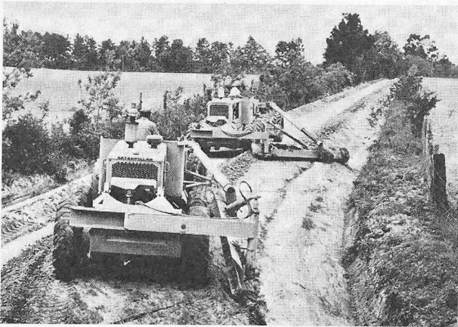
Bild 3. Mit dem Böschungsebner können feuchte und trockene Gräben angelegt und gereinigt werden

gerät, verwendet, das das Belagsmaterial direkt in den Graben leitet.