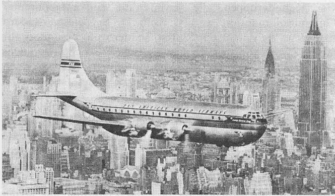
Boeing 377 Stratocruiser der Pan American World Airways über New York