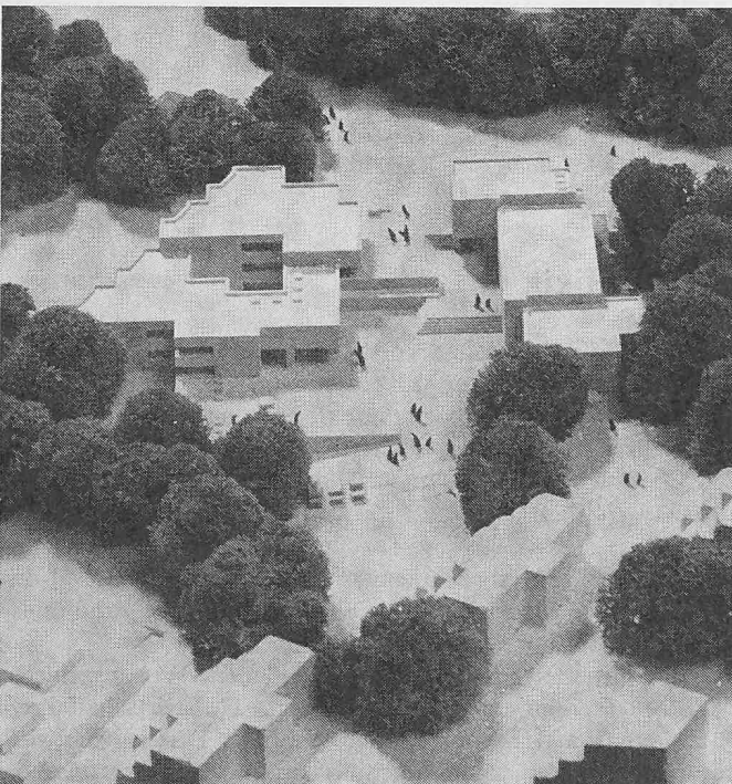
Modell aus Nordosten