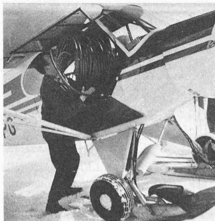
Bild 5. Der verstorbene Gletscherpilot Hermann Geiger beim Ausladen von Weichpolyäthylenrohren auf der Alp Anzeindaz