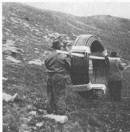
Bild 4. Transport einer Rolle Polyäthylenrohre von 200 m, Durchmesser 50 mm, in den Bergen