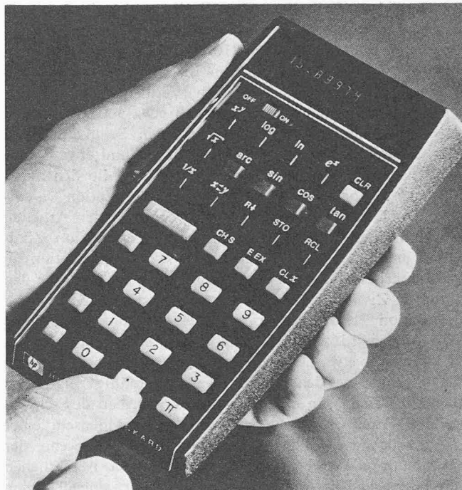
Hewlett-Packard 35, elektronisches Mini-Rechenggerät

Elektronisches Mini-Rechenggerät HP 35. Vor etwa zwei Jahren erschienen die ersten elektronischen Taschen-Rechenmaschinen auf dem Schweizer Markt. Diese gut handgrossen, etwa 700 g schweren, netzunabhängigen Kleinrechner, erschlossen dank ihrer hohen Rechengeschwindigkeit und leichten Bedienbarkeit verbunden mit einer praktisch uneingeschränkten Mobilität dem Vier-Spezies-Bereich eine Reihe neuer Einsatzgebiete. Als modernstes und zugleich bemerkenswertestes Glied in der Entwicklungskette dieser Mini-Computer wird demnächst das Modell 35 der amerikanischen Firma Hewlett-Packard bei der europäischen Fachwelt eingeführt. Dieses nur 300 g schwere, mit vier Arbeitsregistern und einem Konstantenspeicher ausgerüstete Rechenggerät bewältigt alle wichtigen mathematischen und trigonometrischen Grundoperationen durch einfachen Tastendruck mit zehnstelliger Rechenschärfe (Gleitkomma verbunden mit exponentieller Resultatausgabe). Die Verwirklichung dieser verblüffenden Eigenschaften bedingte eine konsequente Miniaturisierung elektronischer Schaltkreise, wie sie in vergleichbarer Form nur in der Raumfahrttechnik angewendet wird. Obwohl man in der noch relativ jungen Computergeschichte gelernt hat, mit dem Ausdruck «revolutionär» vorsichtig umzugehen, dürften mit der Einführung dieses Mikro-Computers die Rechengewohn-