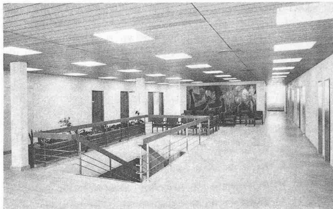
Wartehalle im Obergeschoss des Untersuchungstraktes. Rechts Röntgenabteilung, links die Zimmer der beiden Chefärzte, je mit Untersuchung und Sekretariat (Wandbild: Frl. A. Ruppanner)