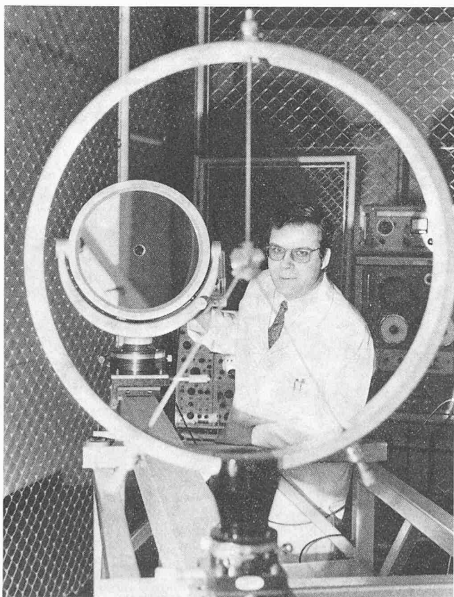
Bild 1. Cassegrain-Teleskop einer Kopfstation der Versuchsstrecke. Im Vordergrund der konvexe Okularspiegel. Das Bild zeigt die Empfangseinrichtung

Der bei den Versuchen eingesetzte CO 2 -Laser sendet bei einer Ausgangsleistung von 5 W eine Infrarot-Strahlung von 10,6 \mu m Wellenlänge aus. Ursprünglich stand die Verwendung eines Helium-Neon-Lasers zur Diskussion. Die bisherigen Messungen in München haben jedoch bestätigt, dass der unsichtbare Infrarot-Strahl gegenüber atmosphärischen Einflüssen wesentlich geringer anfällig ist als der sichtbare Helium-Neon-Strahl. Dies kommt zustande, weil die Wellenlänge des verwendeten CO 2 -Lasers in einen Spektralbereich fällt, in dem die Atmosphäre ein sogenanntes optisches Fenster aufweist.