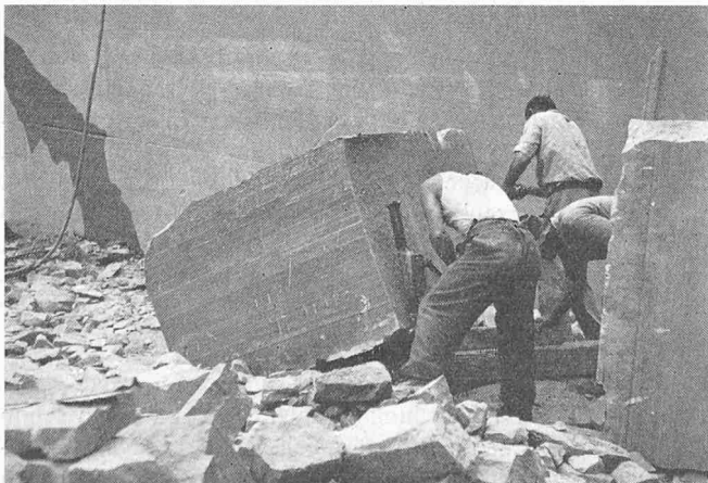
Bild 3. ... und dort sind drei Handlanger nötig, um den Block mit Fusswinden mühsam weiter zu bewegen

Platten ist die Waage fast im Gleichgewicht; sind doch solche mit geschroteten oder gespitzten Kanten noch eine Idee billiger als die maschinengefügten. Nächstes Jahr wird es wohl umgekehrt sein.