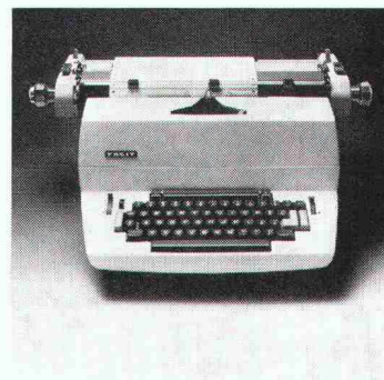
Ausgabe-Schreibmaschine Modell 9861A für die programmierte Ausgabe von Resultaten in Tabellenform.

Dieser einzigartige Tischrechner ist jederzeit und sofort zur Arbeits- und Datenaufnahme bereit. Wann und wo immer Sie ihn brauchen. Sie sind also unabhängig und können unvermeidbare Wartefristen von Servicebüros überbrücken.