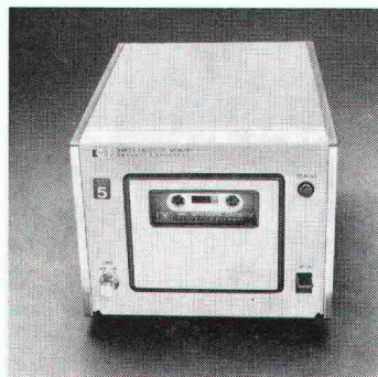
Magnetbandkassette Modell 9865A. Mit diesem preiswerten Massenspeicher lassen sich bis zu 48000 Programmschritte oder 6000 Daten verarbeiten.