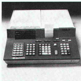
Tischrechner Modell 9810A mit 2036 Programmschritten, 111 Datenspeichern und exklusivem Textausdruck auf dem Streifen-drucker.