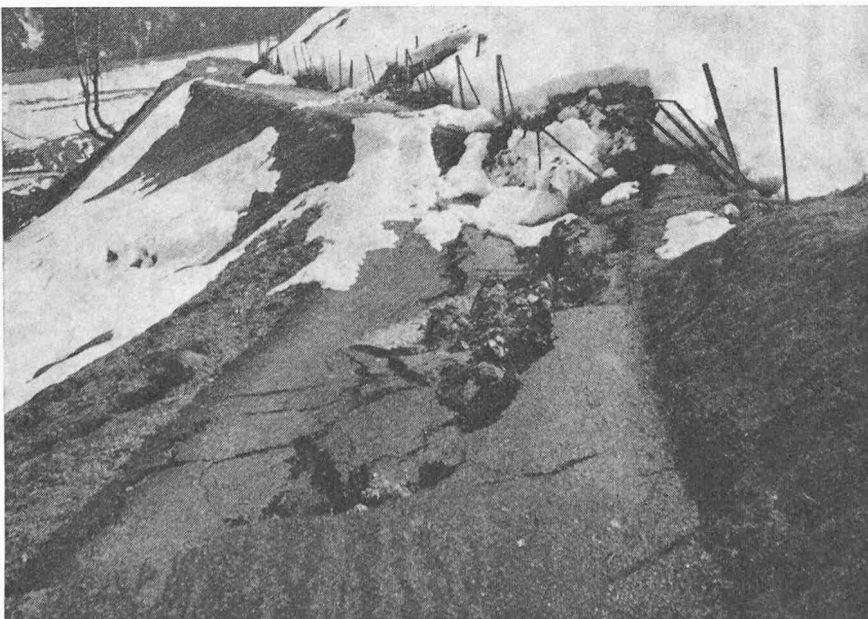
Bild 9. 200 m oberhalb eines Bauwerkes ab-gesackte Nebenstrasse. Der ganze Hang, mehrere Meter mächtige Lehme und verwitterte Gesteinsmaterialien umfassend, geriet in Bewegung.

«Le calcul d'une fondation est loin d'être une science exacte. On ne peut pas appliquer les mêmes principes à tous les problèmes qui surviennent à cause de la nature différente des sols en chaque site et même pour un site donné, des diverses méthodes d'exécution et de l'influence inégale des conditions climatiques et des eaux souterraines sur des sols différents. C'est pourquoi les descriptions d'accidents et une discussion de leurs causes et conséquences fournissent un