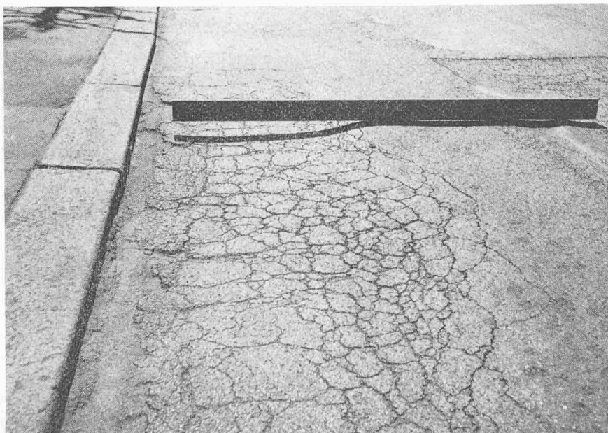
Bild 7. Stadtstrasse, Rillenbildung und Belagszerstörung.

Grund: Frostgefährdete Materialien im Unterbau oder auch im Oberbau.