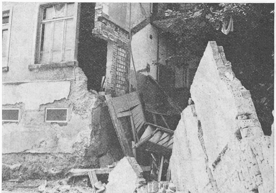
Bild 8. Einsturz einer Hausecke.

Grund: Unterspülung nach dem Ausheben einer Grube.