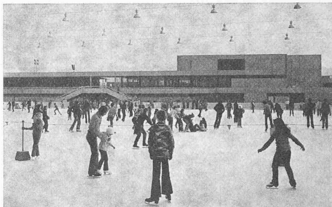
Die Kunsteisbahn im Betrieb (anfangs 1972)

bis 0 Stunden am Schluss des Betonierens. Ein Bespritzen der noch frischen Betonoberfläche mit einem chemischen Nachbehandlungsmittel verzögerte den Austrocknungsprozess.