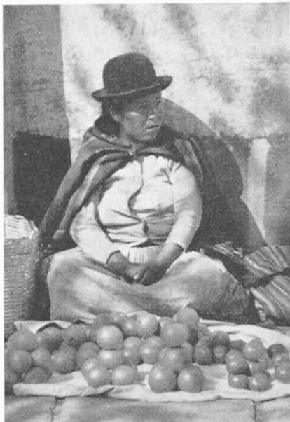
Bild 2. «Chola», die Indianerfrau, die mit ihrem Hut als Standeszeichen ihre selbstgebauten Früchte festhält