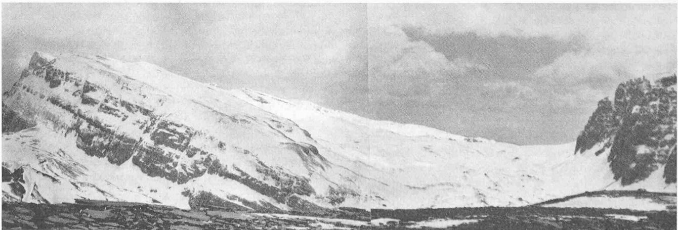
Bild 1. Mögliches Skigebiet im Tymfi-(Zagorion-) Gebirge, Epirus. Links Hauptgipfel Pindos (2500 m ü. M.), rechts Papington-Pass

wurde er für diese Gesellschaft beratender Ingenieur im weitesten Sinne. Diese Studien und Beratungen gingen von Seilbahnstudien zu Seilbahnausführungsprojekten, von Geleise- und Zahnstangenproblemen bis zu Lawenverbauungen. Es folgten Arbeiten in Japan und in den USA, welche aber, teilweise durch schweizerische Auftraggeber durchgeführt, weniger in diesen Zusammenhang gehören. Ein Auftrag – über die OECD erhalten – hatte Erschliessungspro-