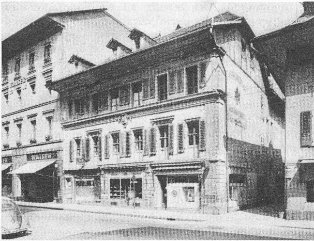
Das Tscharnherhaus an der Amtshausgasse in Bern, 1735