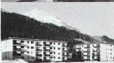
Überbauung Rietstrasse, Elektrizitätswerk der Landschaft Davos; total 33 Wohnungen; Anschlusswert ca. 400 kW

Star Unity AG Fabrik elektrischer Apparate Zürich, in Au/ZH Tel. 01 75 04 04