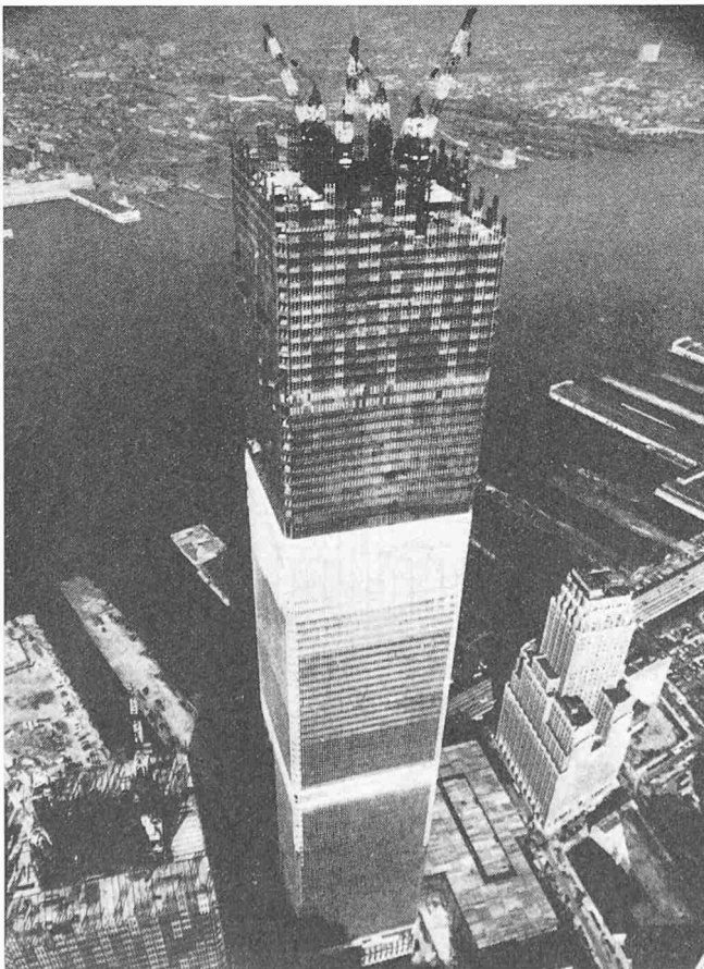
World Trade Center in New York. Das höchste Gebäude misst 412 m über Boden, rd. 100 Geschosse, 50 000 Angestellte, 80 000 Besucher täglich

macht. Voraussagen auf Grund unseres derzeitigen Wissens (oder Unwissens) sind mit Vorsicht aufzunehmen. In ihren Schlüssen übersehen die Wissenschaften oft den zugehörigen weiteren Rahmen. «Alles fließt», und der stete Wandel ist das einzig Währende. Wissenschaft schützt vor Torheit nicht!