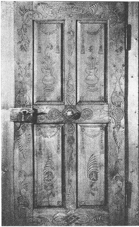
Schwellbrunn, Haus Nr. 14. Geschnitzte, 1809 datierte Zimmertüre aus Nussbaumholz mit Rokoko- und Louis-XVI-Motiven sowie Initialen (Abb. 254)