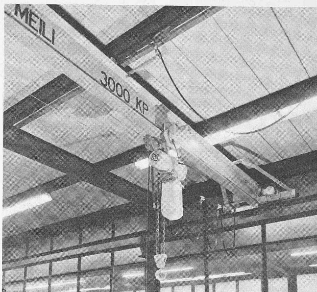
Elektro-Laufkran in Obergurt-Ausführung (auch als Untergurt-Ausführung erhältlich)