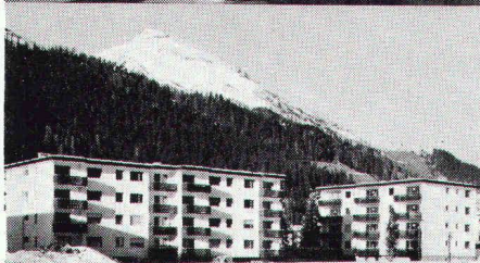
Überbauung Rietstrasse, Elektrizitätswerk der Landschaft Davos; total 33 Wohnungen; Anschlusswert ca. 400 kW