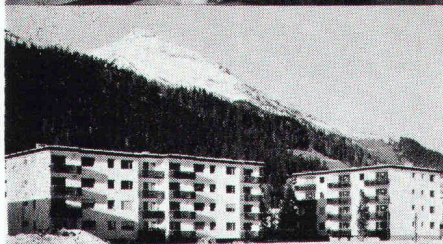
Überbauung Rietstrasse, Elektrizitätswerk der Landschaft Davos; total 33 Wohnungen; Anschlusswert ca. 400 kW

Star Unity AG Fabrik elektrischer Apparate Zürich, in Au/ZH Tel. 01 75 04 04