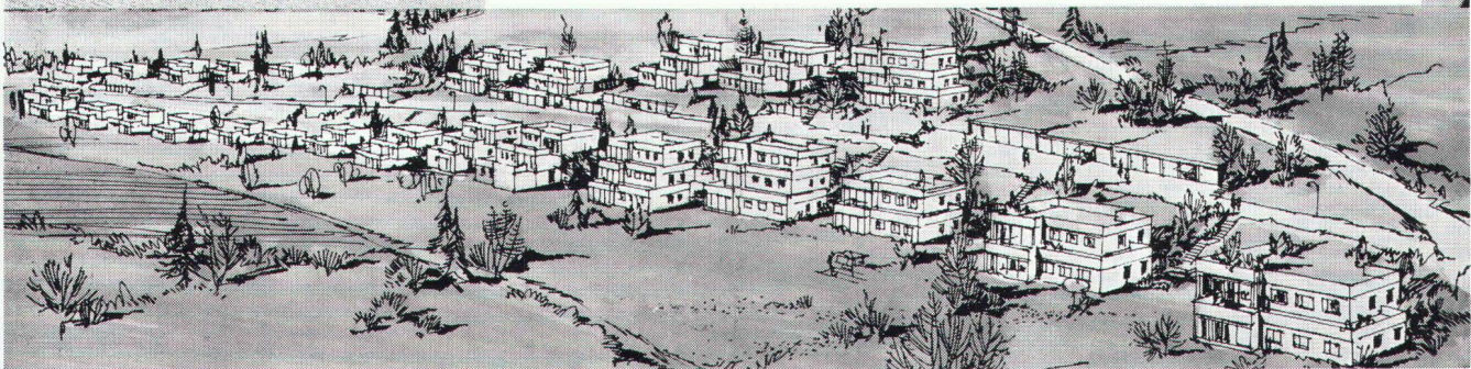
Terrassen-Überbauung Egolzwil, Arch. J. Hasler, Zürich; Bauherr Real-Grund AG, Opfikon; 67 Häuser; Anschlusswert ca. 1450 kW

Star Unity AG Fabrik elektrischer Apparate Zürich, in Au/ZH Tel. 01 75 04 04