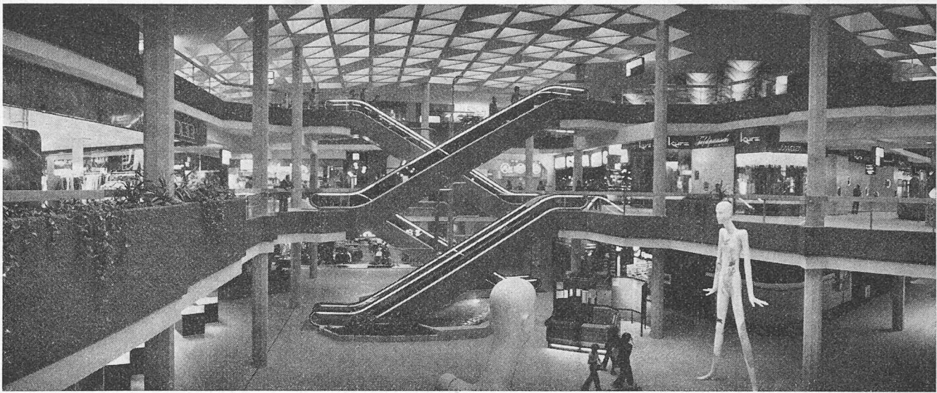
Blick in die Haupt-Mall mit Rolltreppenanlage

Im weiteren wird die Feuerwehr durch Blinksignale, die an den Aussenfassaden montiert sind, über die Stelle des Brandherdes orientiert. In Abhängigkeit der Brandmelder werden die entsprechenden Lüftungs- und Klimaanlage abgeschaltet. Die Abluftventilatoren können von Hand für den Rauchabzug in Betrieb gesetzt werden.