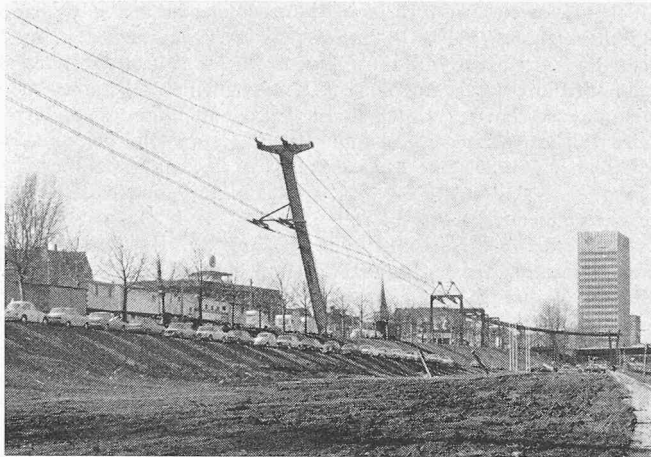
Bild 1. In Bildmitte ist eine typische Stütze der ersten Teilstrecke sichtbar. Sie bestehen im Prinzip aus einem schiefen Dreibein, von dem die zwei Beine rechts als Abspannseile ausgebildet sind. Um den betrieblichen Seilbewegungen Rechnung zu tragen, sind die 4 Seilstränge längsverschieblich an der Stütze befestigt. Rechts im Bild ist die Abspannstelle mit dem Kurvenbauwerk sichtbar. Nach rechts überquert das Trasse den Neckar

Ein Teil der Strecke ist über einer Eisenbahnlinie geführt, und es werden verschiedene Strassen, Strassenbahnen und das an dieser Stelle etwa 170 m breite Flussbett des Neckar überquert (Bild 2). Etwelche Probleme bot die Füh-