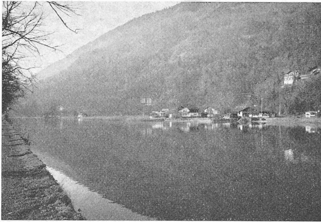
Photogrammetrische Geländeaufnahme mit Passpunkten