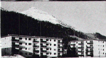
Überbauung Rietstrasse, Elektrizitätswerk der Landschaft Davos; total 33 Wohnungen; Anschlusswert ca. 400 kW

Star Unity AG Fabrik elektrischer Apparate Zürich, in Au/ZH Tel. 01 75 04 04