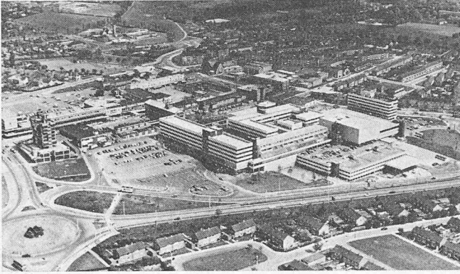
Luftaufnahme des Stadtzentrums von Corby in den englischen Midlands