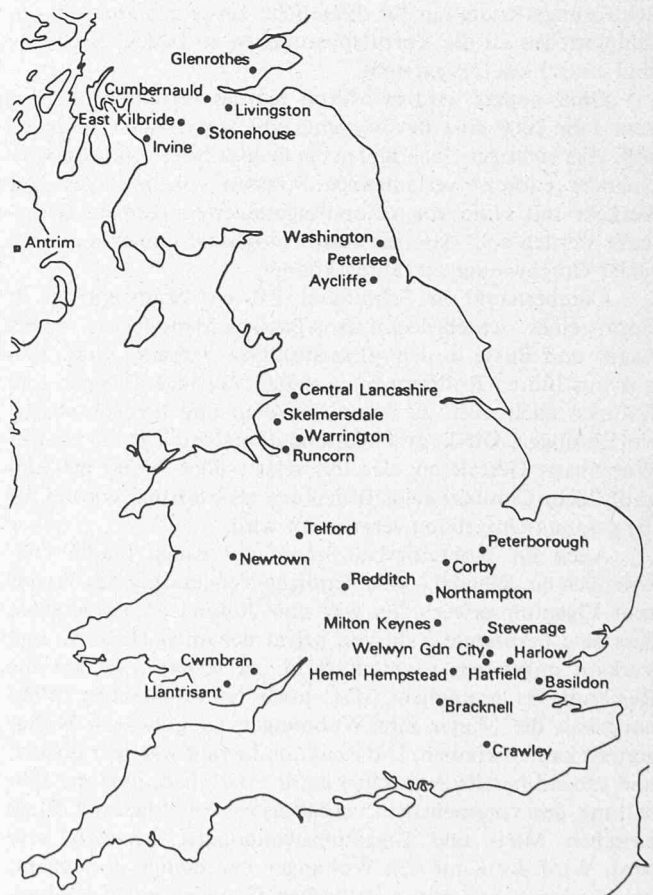
Die in den vergangenen fünfundzwanzig Jahren geplanten englischen Städte

In Stevenage – der ersten der neuen Städte – wurde das Einkaufszentrum von Anfang an als Fussgängerzone geplant, allerdings mit leicht erreichbaren Parkmöglichkeiten. Heute baut man weitere, mehrgeschossige, an eine grösse Zahl von Geschäften angeschlossene Grossgaragen, um dem erhöhten Bedarf nachzukommen. Dennoch werden vielleicht noch mehr Parkplätze benötigt. Aufgrund eines derzeitigen Expansionsplans soll die Bevölkerung der Stadt von den ursprünglich vorgesehenen 100 000 auf 150 000 Menschen erhöht werden.