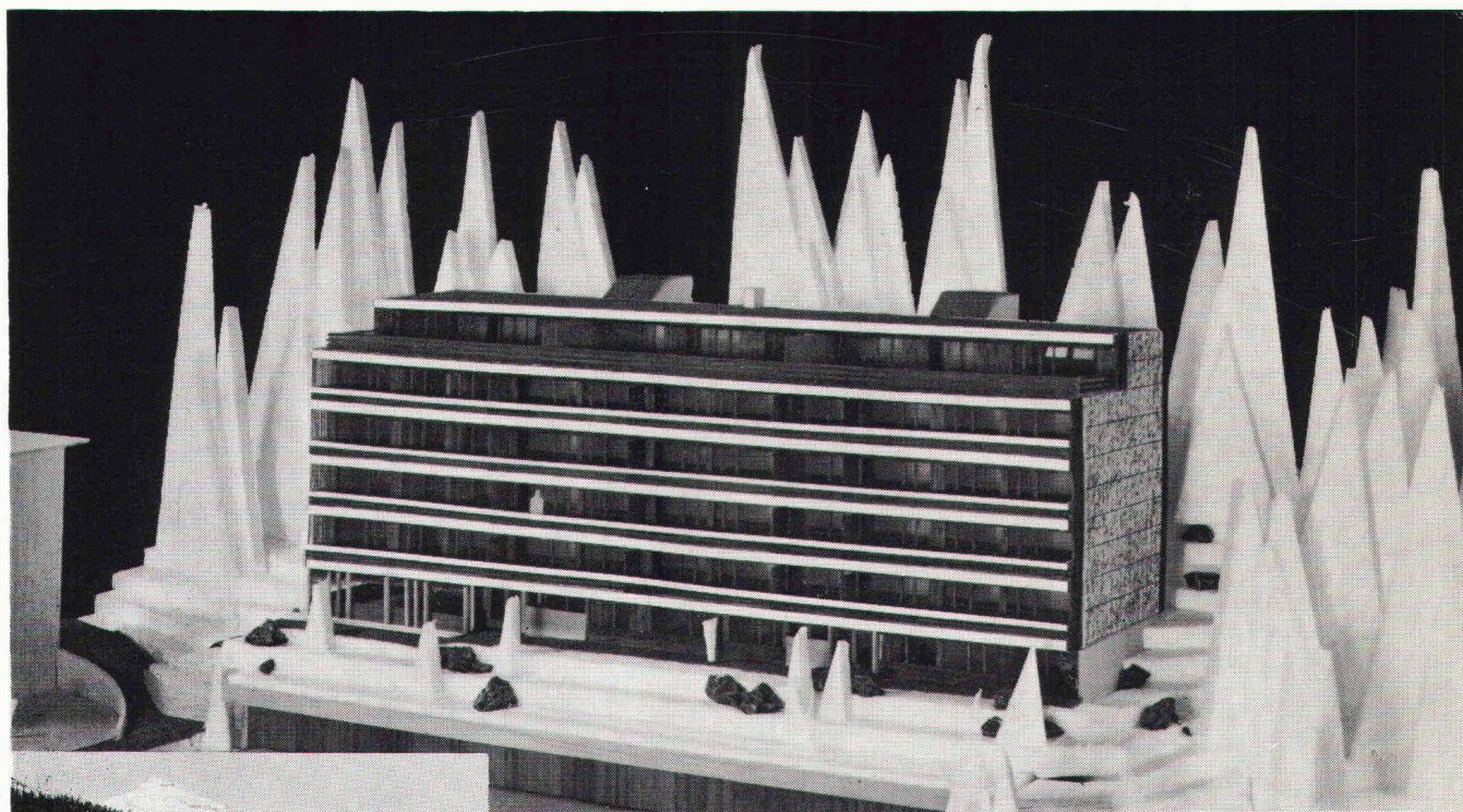
Überbauung Meiliboda 2, Elektrizitätswerk Arosa; total 30 Wohnungen; Anschlusswert ca. 380 kW

Herausgegeben von der Verlags-AG der akademischen technischen Vereine, Zürich