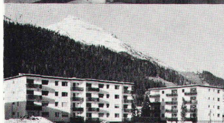
Überbauung Rietstrasse, Elektrizitätswerk der Landschaft Davos; total 33 Wohnungen; Anschlusswert ca. 400 kW

Diese Grossüberbauungen werden vollelektrisch beheizt und leisten einen bedeutenden Beitrag zum Umweltschutz