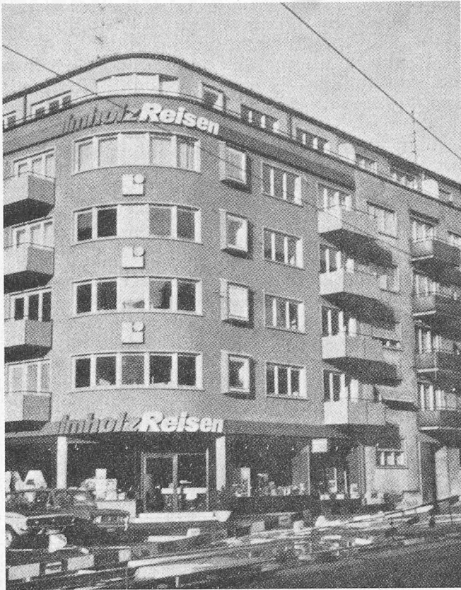
Wohnhäuser, die in Zürich-Wiedikon in Geschäftshäuser umgewandelt worden sind. Wo bleiben die Stadtbewohner? (Aus «Unirenova»-Magazin Nr. 2/1975)

Handwerkerfirmen müssen sich intensiver mit der besonderen Problematik des Altbaues befassen. Der Umgang mit Werkstoffen wie Naturstein und Holz ist vielen Handwerkern nicht mehr geläufig. Die Verwendung falscher Materialien kann hier zu fatalen Bauschäden führen. Konzeptionelle Hilflösigkeiten zeigen, dass auch nicht jeder Architekt oder Ingenieur mit diesem Spezialgebiet genügend vertraut ist.