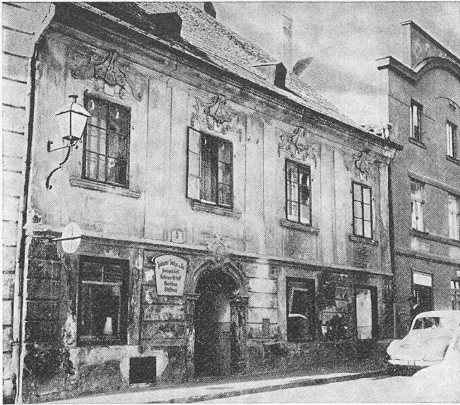
Krems a. d. Donau: Das Haus Schmidgasse Nr. 3 vor der Restaurierung