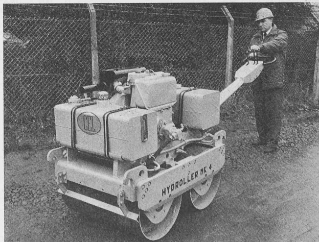
Rüttelwalze «Hydroller» Mark 4 M

Compacting Equipment Ltd., Warwick CV34 5AR, England