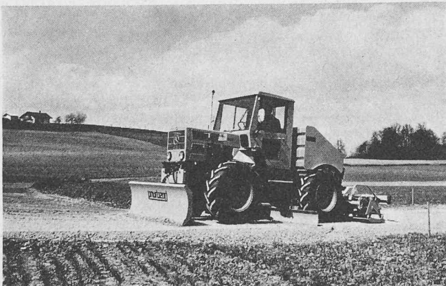
Die MBB 5 = 1 mit Grobplanierschild, Feinplanierschild und Plattenverdichter beim Bau einer Gemeindestrasse

Marcel Boschung, Maschinenfabrik, 3185 Schmitzen