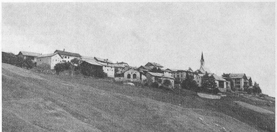
Guarda — ein Kleinod auf 1650 Metern

Zwischen den beiden Unterengadiner Dörfern Lavin und Ardez hat sich der wilde junge Inn so tief und steil eingefres-sen, dass kein Platz mehr für eine Siedlung ist. Oben, am lin-ken Talhang aber, auf 1650 m, hat der Fluss eine Sonnen-terrasse stehengelassen. Sie trägt das, so sagt man, schönste Engadiner Dorf: Guarda. Eine kurvenreiche Bergstrasse mün-det unvermittelt in die malerische, enge Dorfgasse. Man ist umgeben von prachtvollen, eng aneinandergerückten, sgraf-fitoverzierten Steinhäusern und Bauernhöfen mit Trichterfen-tern, bezaubernden bemalten Erkern, mächtigen, schattigen Torbögen, ausladenden Brunnen. Es ist die typische rätsch-